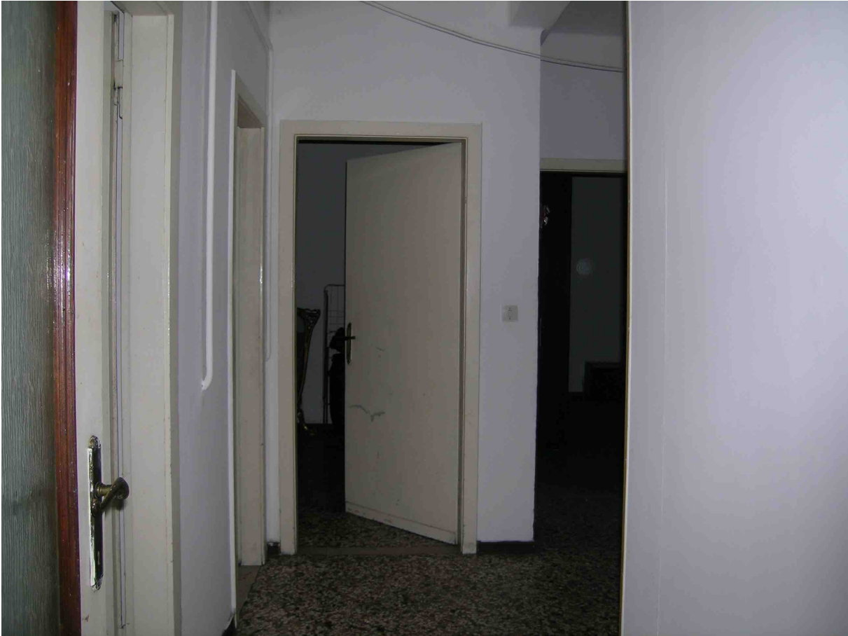
Corridoio di distribuzione e una camera