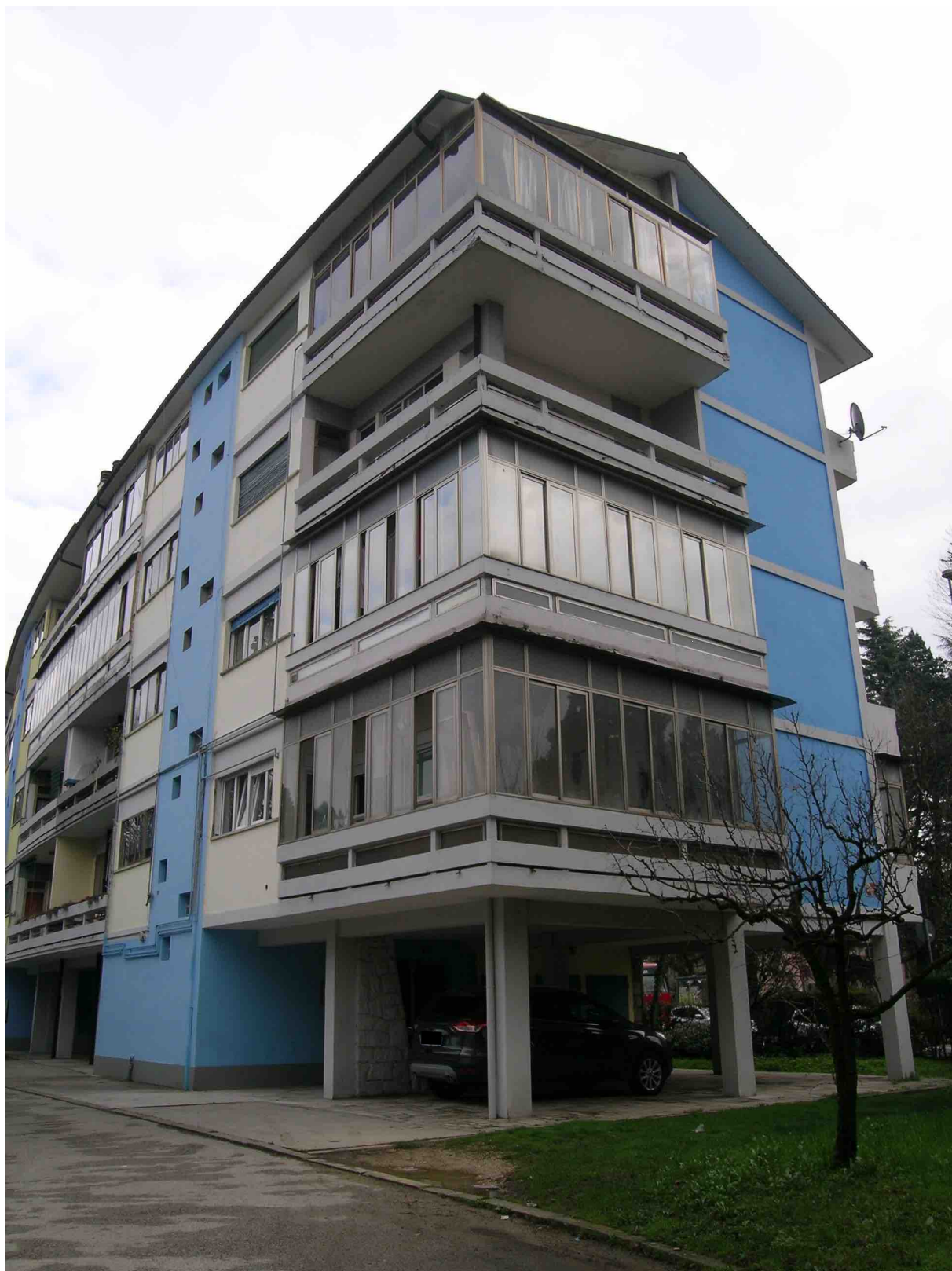
Vista dell' immobile condominiale