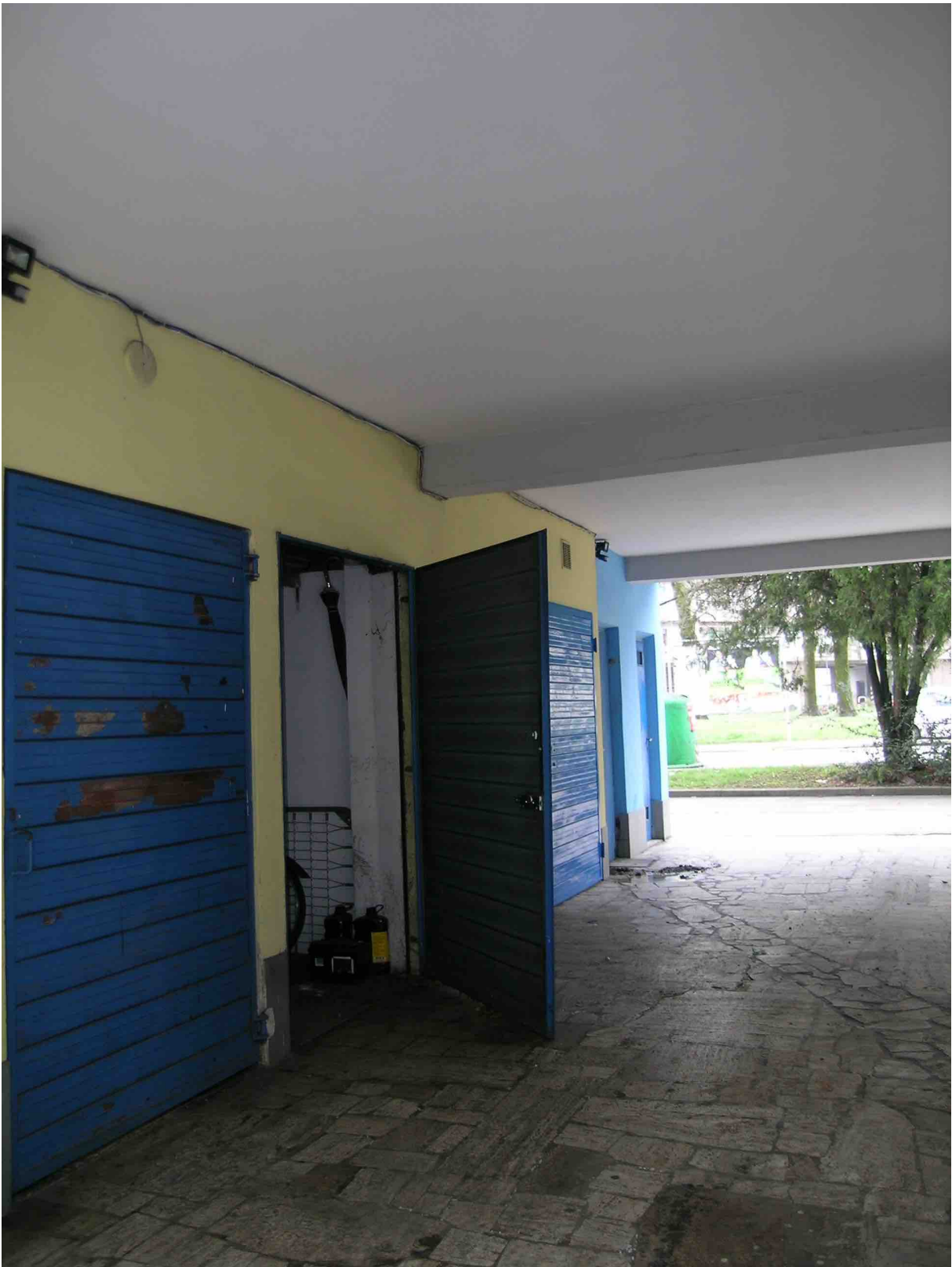
Cantina al piano terra