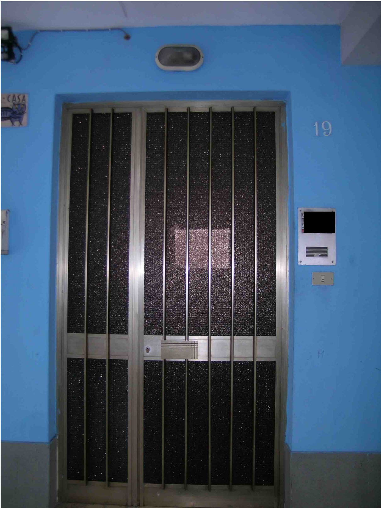
Portoncino d' ingresso condominiale