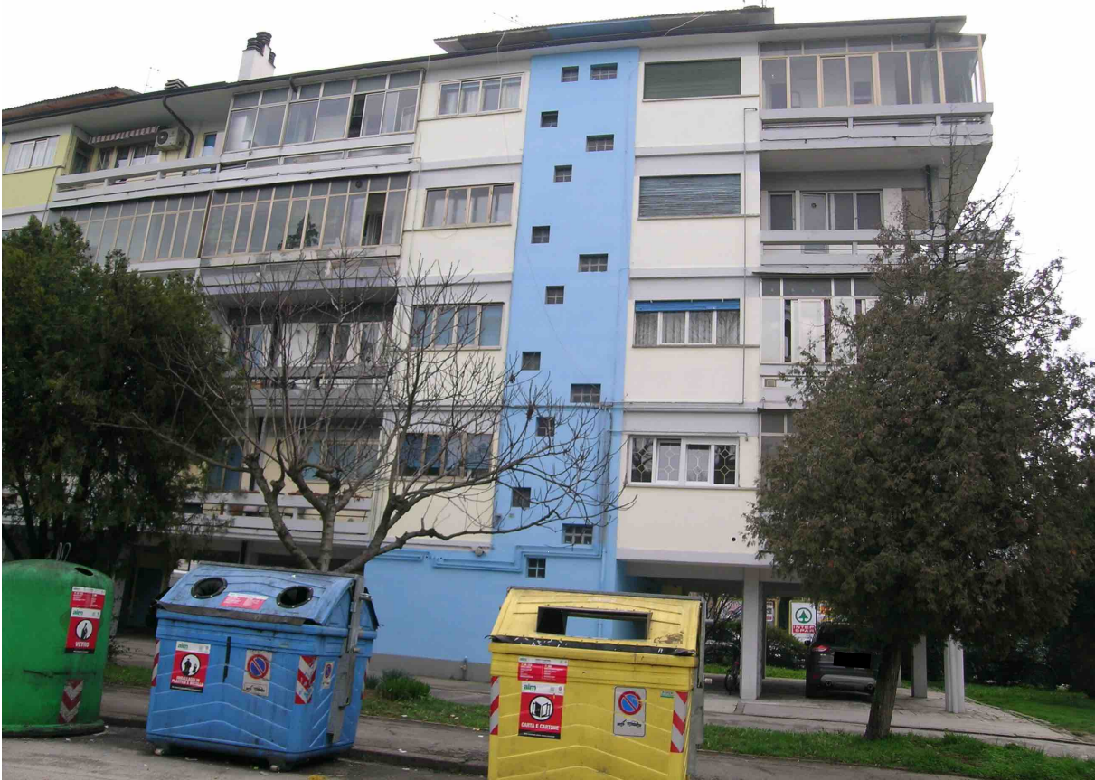
Viste dell' immobile condominiale