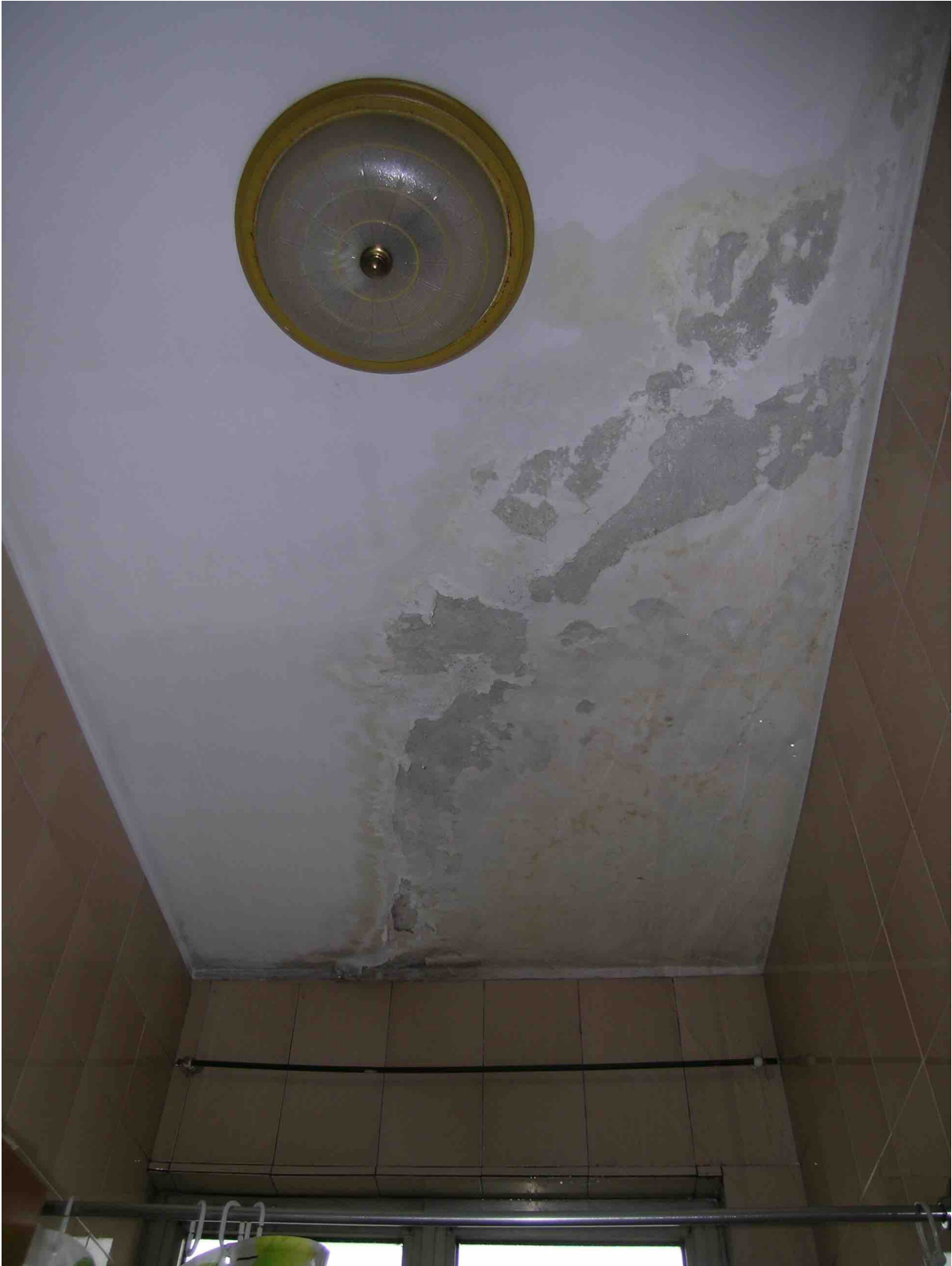
Soffitto del servizio igienico