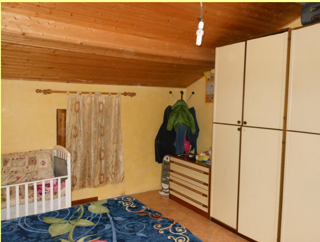
Figura 25 - Camera n.3