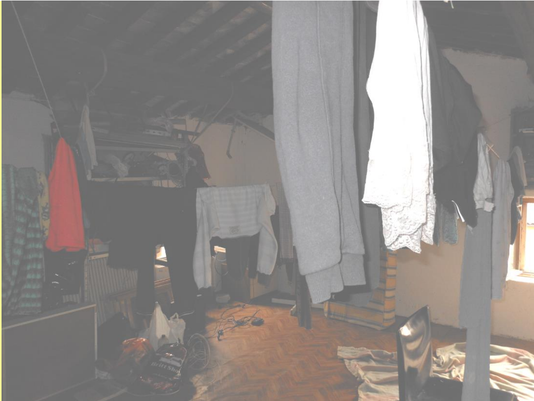
Figura 28 – soffitta (piano secondo)