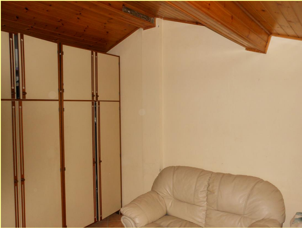
Figura 20 – “camera” n.2