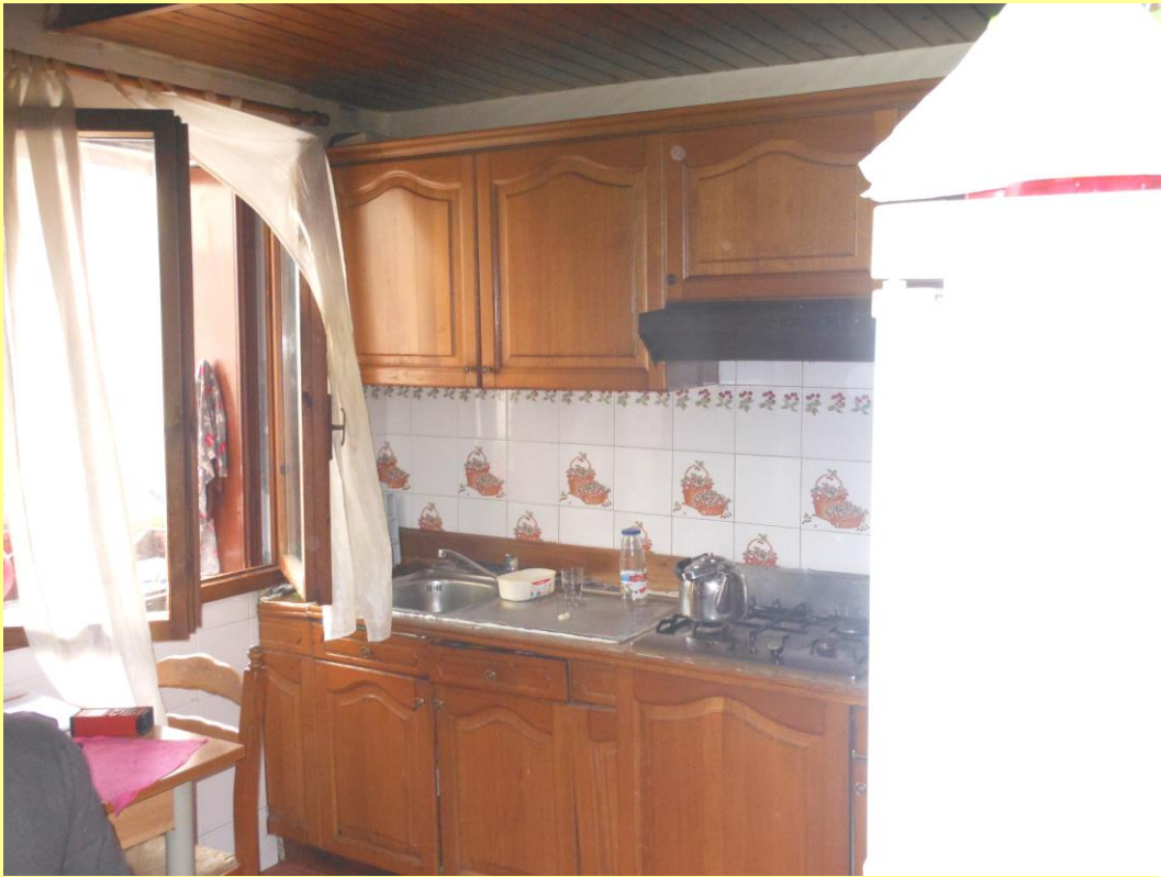
Figura 10 – Cucina - pranzo