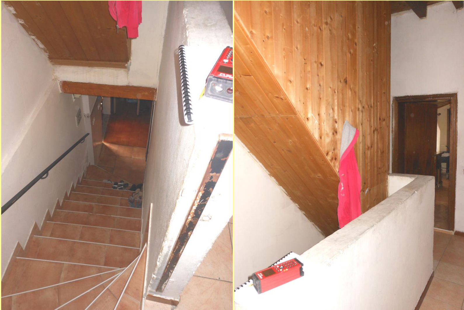
Figura 17 – Vano scala dal piano terra al primo. Sulla destra, vano scala verso il piano secondo