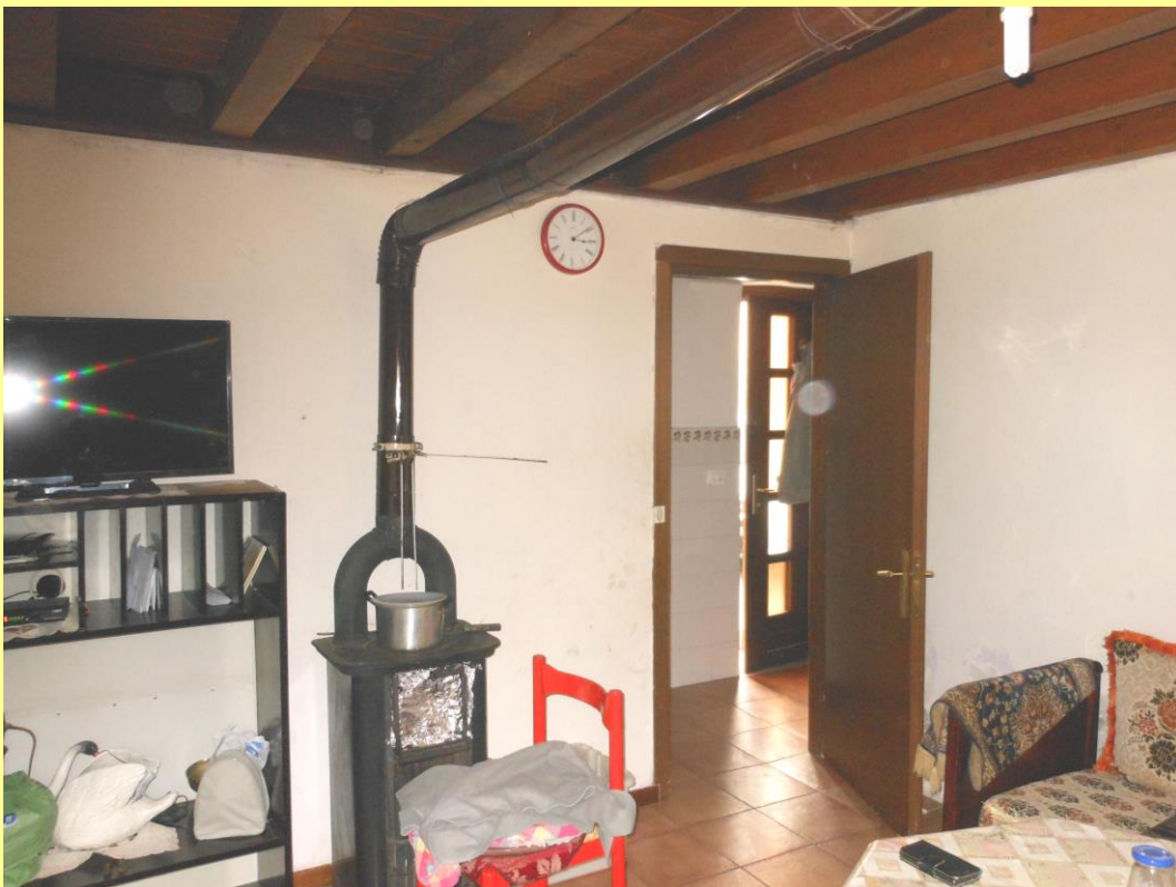
Figura 16 – Soggiorno e nello sfondo, la porta d’ingresso all’abitazione