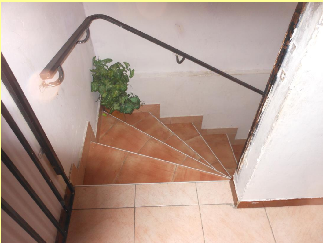
Figura 30 – Particolare della scala verso il piano terra