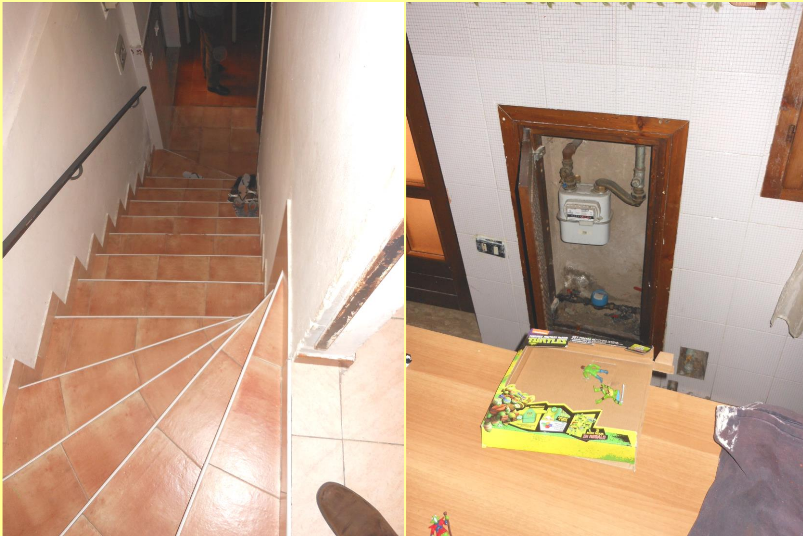
Figura 31 - Particolare della scala verso il piano terra e, a destra, dei contatori gas e acqua