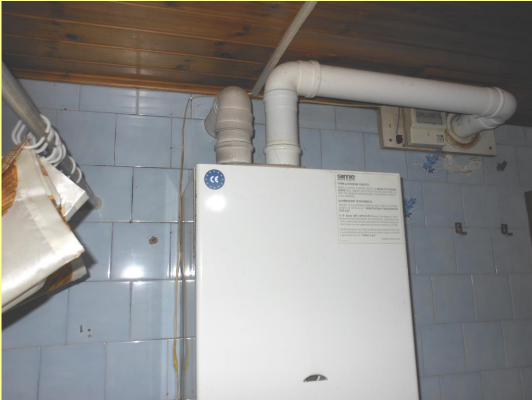
Figura 33 - Particolare della caldaia per la produzione dell'acqua calda