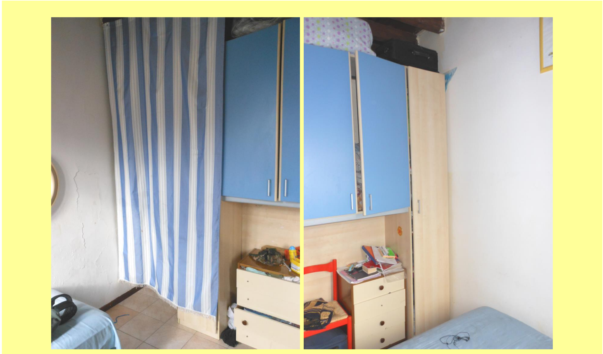
Figura 18 – Camera separata con un armadio ed una tenda rispetto al vano scala