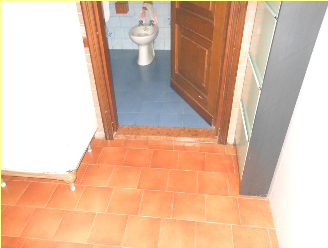
Figura 13 – Particolare dei pavimenti nel passaggio di accesso al bagno