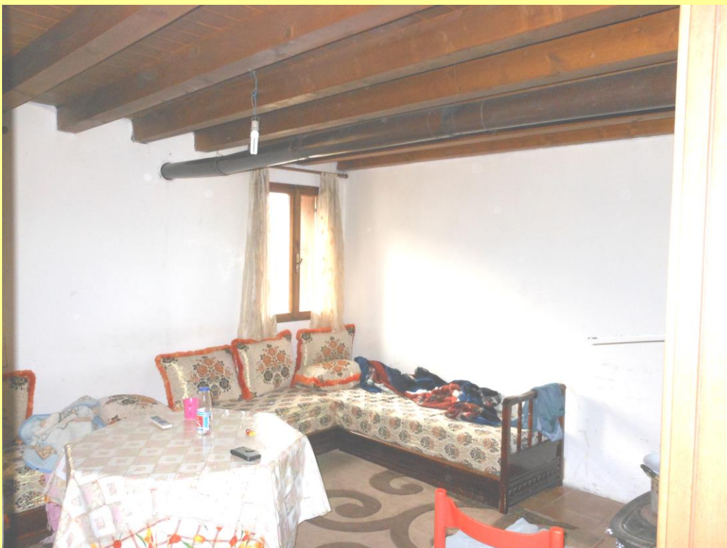
Figura 14 - Soggiorno