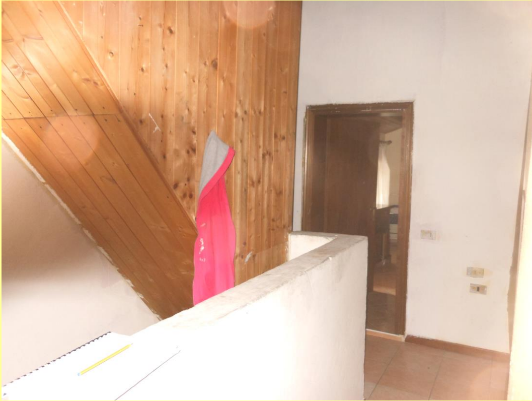
Figura 29 - Disimpegno della camera 1 e scala dal piano primo al piano secondo