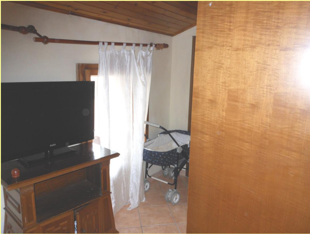
Figura 22 – Passaggio nella camera n.2 verso la camera n.3