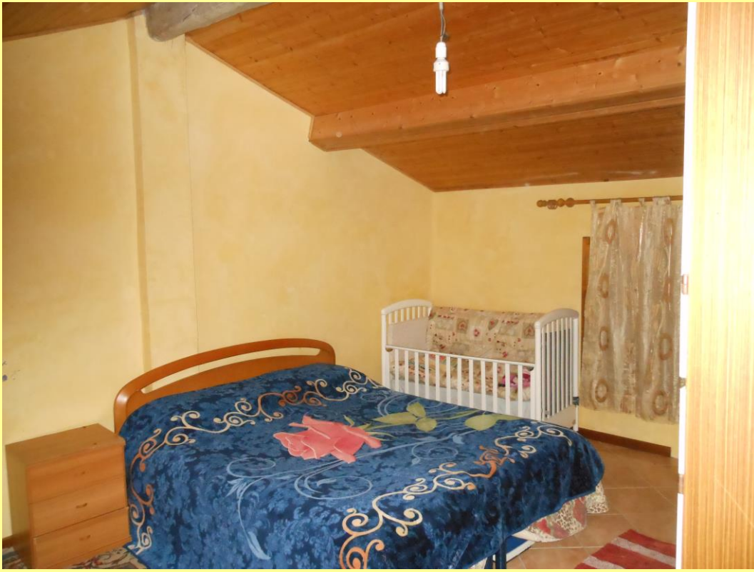
Figura 24 - Camera n.3