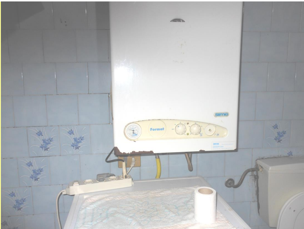
Figura 34 - Particolare della caldaia per la produzione dell'acqua calda