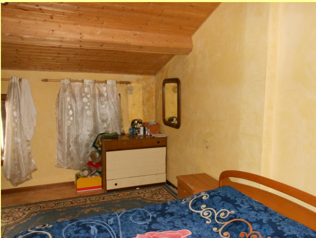
Figura 23 – Camera n.3