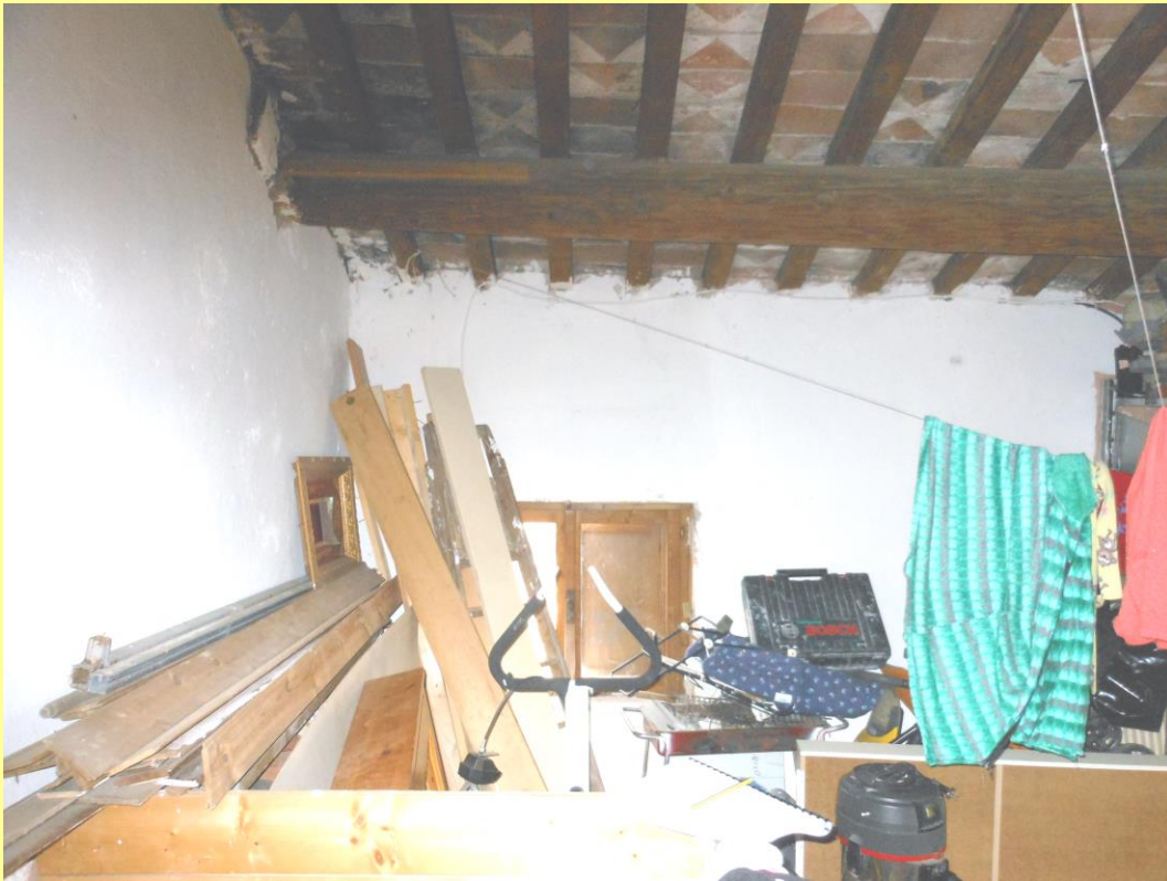
Figura 27 – Soffitta (piano secondo)