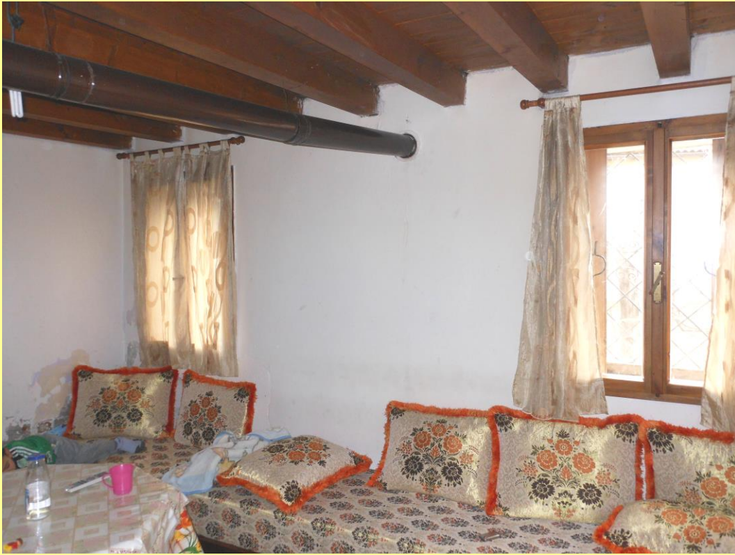
Figura 15 - Soggiorno