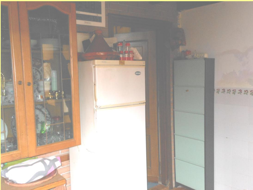
Figura 11 - Cucina – pranzo / porta verso l'unico bagno della casa.