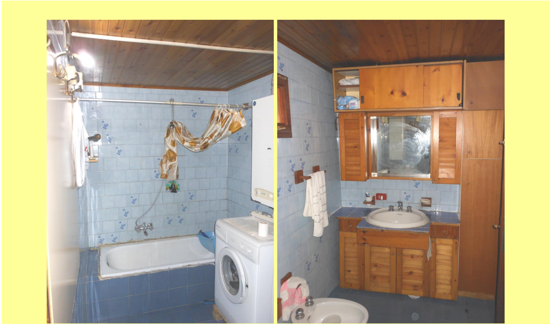
Figura 12 – Bagno