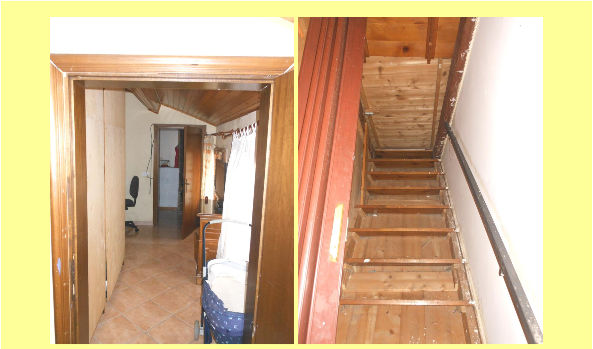
Figura 26 – Passaggio dalla Camera n.3 alla scala – a Destra: scala, con botola, verso il piano secondo