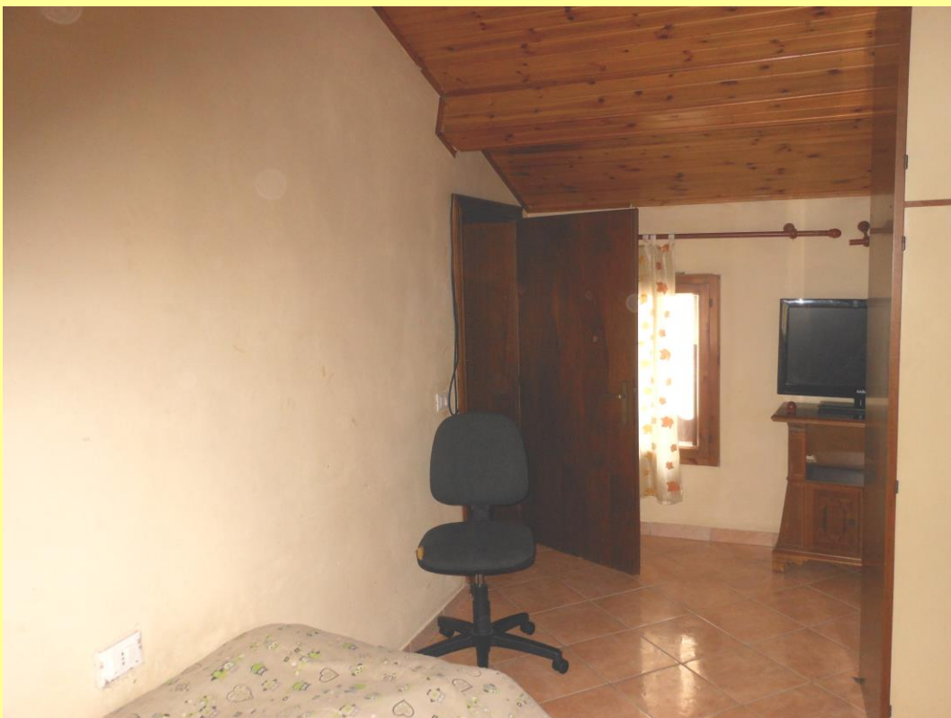
Figura 21 – Altra foto della camera n.2