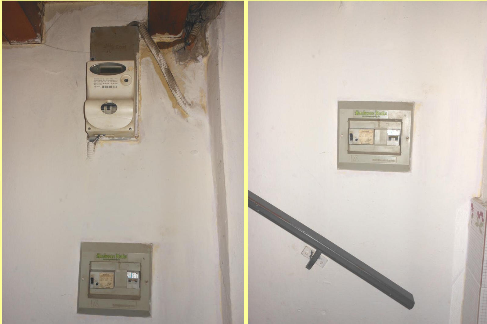
Figura 32 - Particolari contatore dell'energia elettrica e quadro