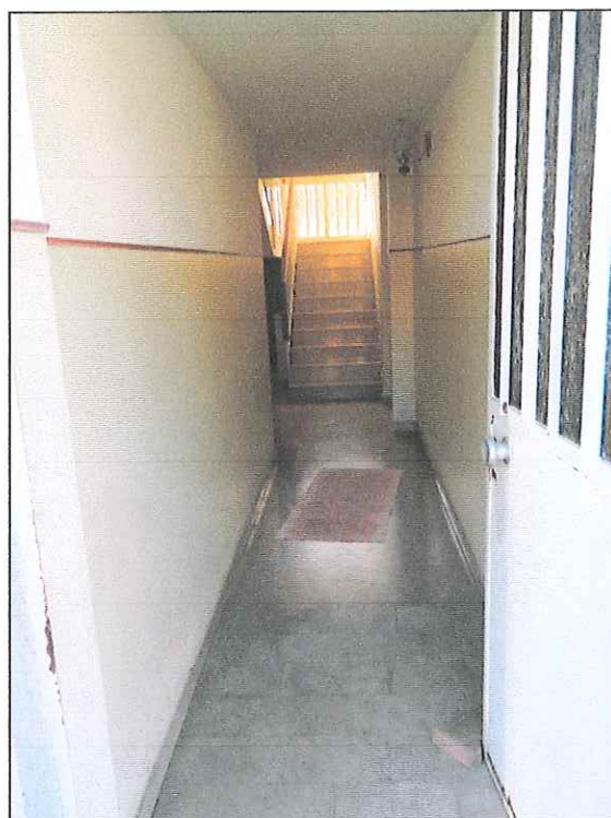
VANO SCALA - ACCESSO APPARTAMENTO