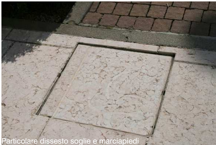
Particolare dissesto soglie e marciapiedi