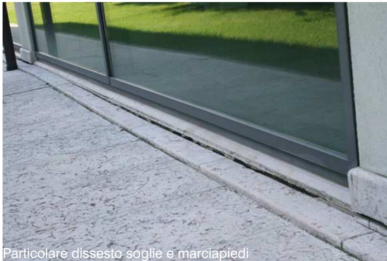
Particolare dissesto soglie e marciapiedi